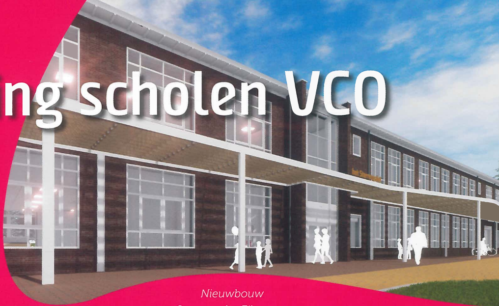
Nieuwbouw Sterrenpalet Eibergen.

VCO vindt het belangrijk dat de scholen goed zijn gehuisvest in gebouwen met een aantrekkelijke uitstraling en goede voorzieningen waarin de leerlingen zich optimaal kunnen ontwikkelen.